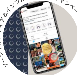
ソーシャルメディア&インフルエンサー・キャンペーン