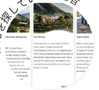
販路を探している生産者